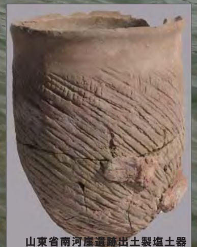
山東省南河崖遺跡出土製塩土器